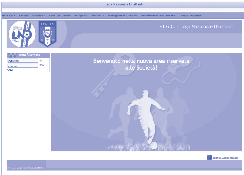
La pagina di accesso all'Area Società, raggiungibile all'indirizzo iscrizioni.lnd.it

Per accedere all'Area Società è necessario essere in possesso delle chiavi di accesso (nome utente e password). Questi dati vengono forniti dal Dipartimento Interregionale o dal Comitato Regionale di provenienza, spediti in busta chiusa al Rappresentante Legale. In caso di smarrimento delle chiavi di accesso è necessario inviare una nuova richiesta di emissione delle stesse su carta intestata della Società, firmata dal Rappresentante Legale.